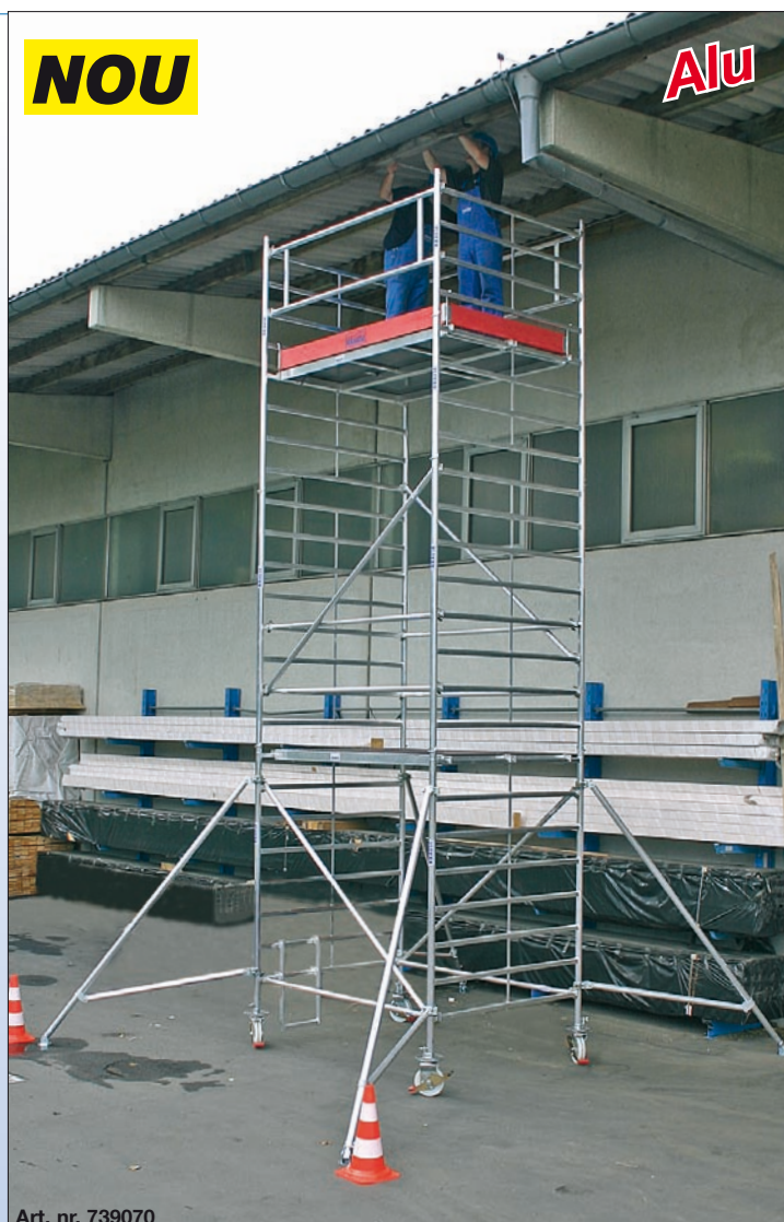
Art. nr. 739070

Important: În funcție de varianta de execuție se vor utiliza contragreutăți (accesorii).