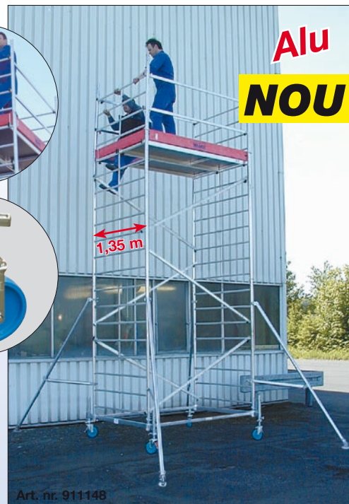
Art. nr. 911148