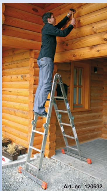
Art. nr. 120632