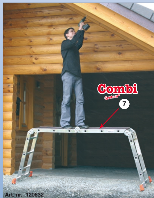
Art. nr. 120632