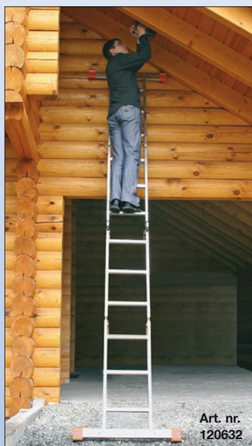
Art. nr. 120632