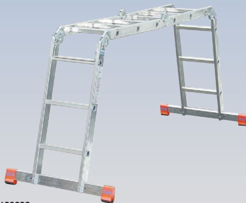
Art. nr. 120632