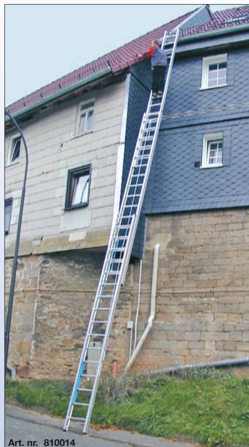
Art. nr. 810014