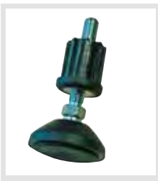
Az állítható magasságú talp biztonsági tartozékként rendelhető