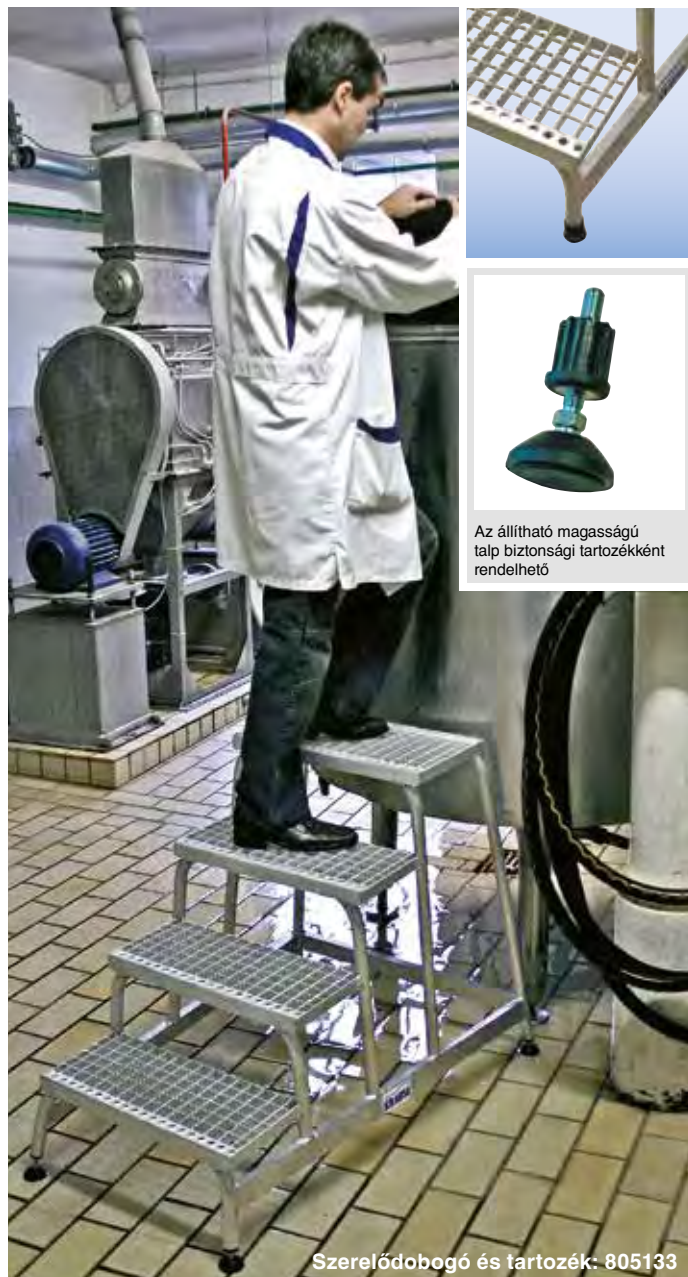
Szerelődobogó és tartozék: 805133